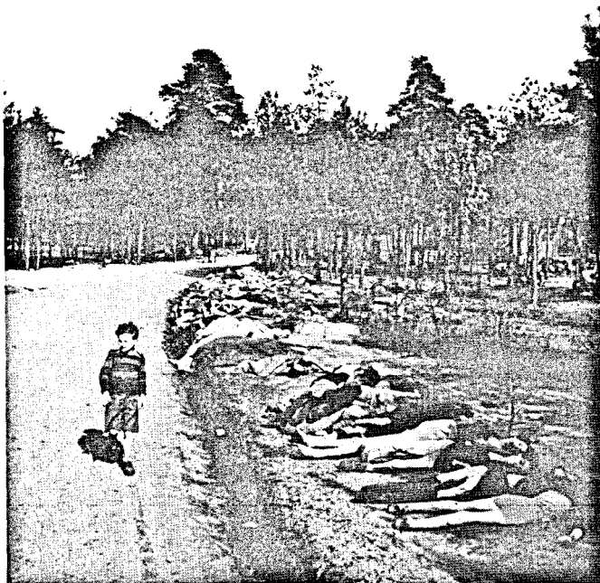
Abb. 4: George Rodger, Young boy dressed in shorts walks along a dirt road lined with the corpses of hundreds of prisoners who died at the Bergen-Belsen extermination camp, near the towns of Bergen and Celle, Germany, April 1945 (71)